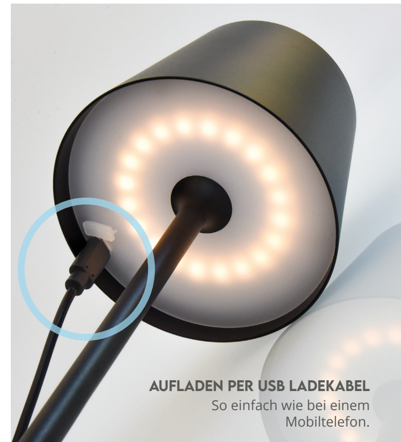
AUFLADEN PER USB LADEKABEL So einfach wie bei einem Mobiltelefon.